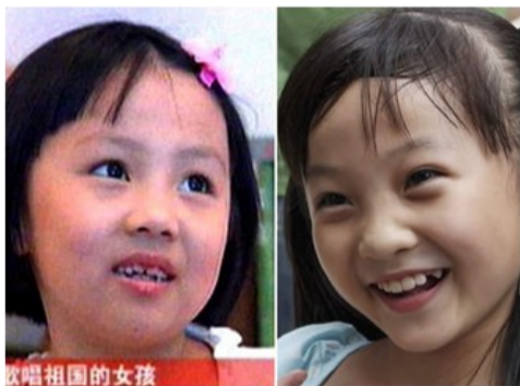
A la izquierda la niña que realmente cantó en la inauguración de los Juegos Olímpicos y a la derecha la niña que salió al escenario.

La niña que impresionó en la inauguración de los JJOO de Pekín, adornada con un traje rojo y cantando Oda a la madre patria, no cantó ni una sola nota, sino que fue elegida por su aspecto físico a diferencia de la cantante real, de cara redondita y los dientes desaparecidos.